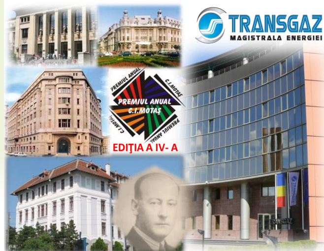
PROIECT DE RESPONSABILITATE SOCIALĂ 2013