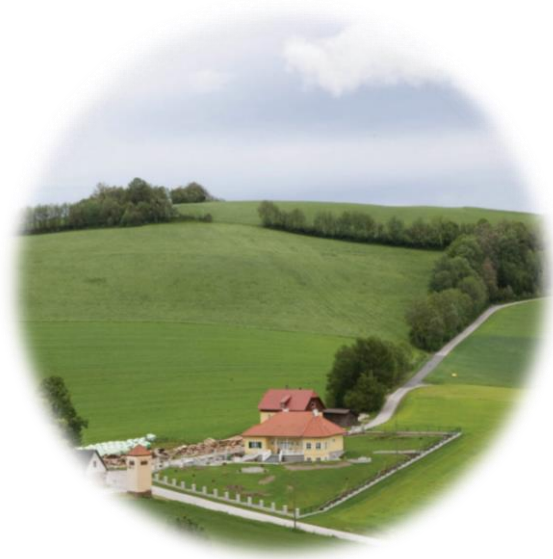
După lucrările de construcție.