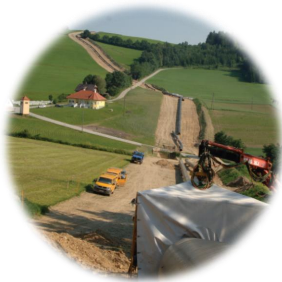
Pe durata lucrărilor de construcție.